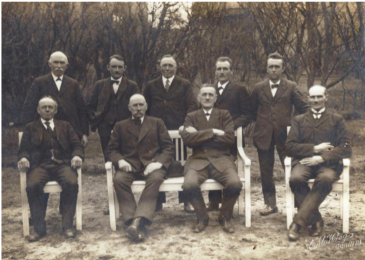
Sognerådet i Vester Hæsinge – Sh. Lyndelse Kommune 1925 – 1929.