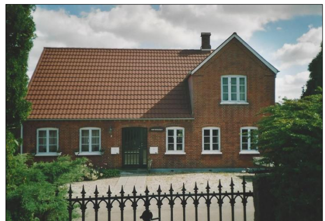
Væverhuset i 2004.