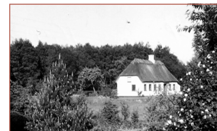
Remset 6, matr. 23g. Foto fra 1950-erne. I dag er der bygget en garage foran huset. Denne er også tækket med strå.