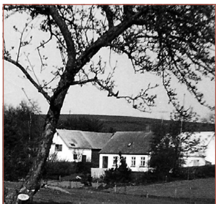
Remset 8, matr. 23h, 23k og 23d og 7d Matr. 7d er tilkøbt i 1929 og er på ca. 10 tønder land.