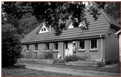
Remset 7, matr. 23l Foto 2009

Remset 7 er et hus der har en strimmel havejord på begge sider af vejen.