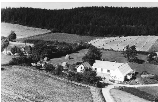
Remset 3, matr. 19c. I baggrunden Remset 1 Foto antagelig fra 1950-erne