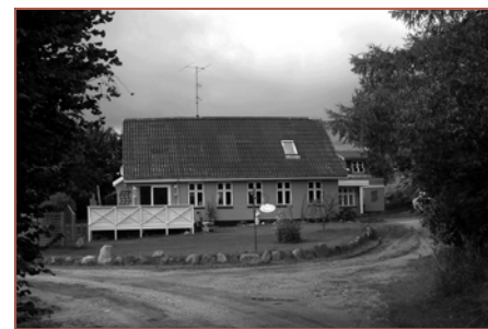
Remset 5, matr. 19e. Foto 2009