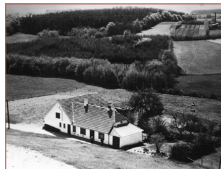
Remset 4, matr. 23f. Foto antagelig 1950-erne

Den oprindelige vej til ejendommen gik fra Ny Stenderupvej 13 og hen over markerne. Omkring 1850 blev der solgt jord fra, så der kunne oprettes to nye ejendomme og samtidig blev den nuværende vej officiel. Der har sikkert været en gangsti flere år før.