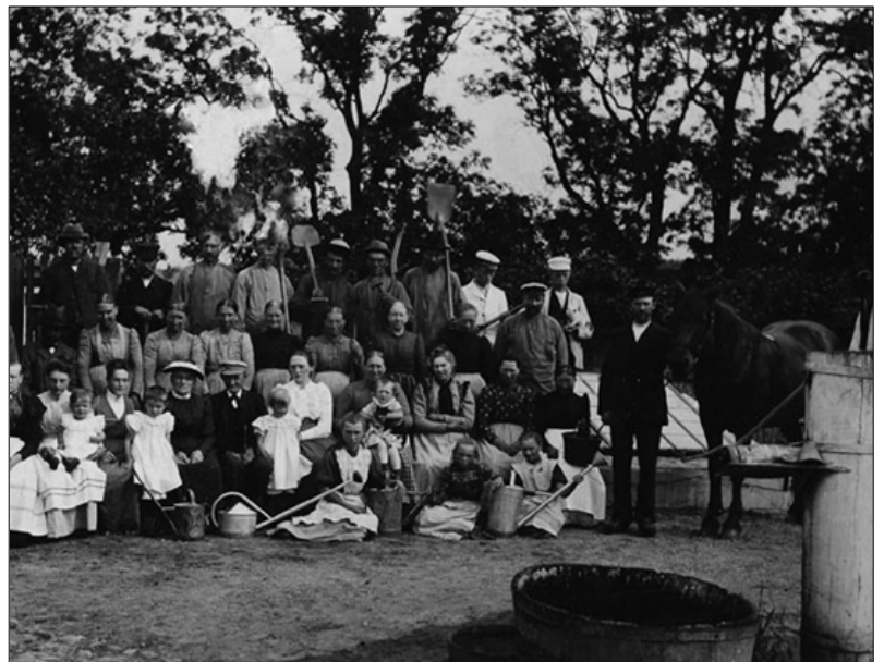
Havearbejdere på Sandholt omkring 1905