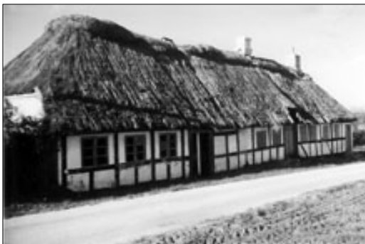
Fattighuset ”Treenigheden” beliggende på Thorslundsvej tilhørte Sandholt.